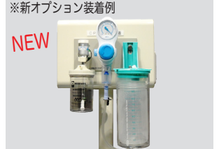
※新オプション装着例

CVP-1030 用テーブル 価格 25,000 円 (税別) ※株式会社中部ビデオプロダクツ製