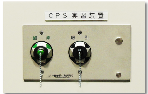
【新しいアウトレットとパネル】